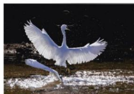
4席「虐待」上本 静樹 (フタバラス)