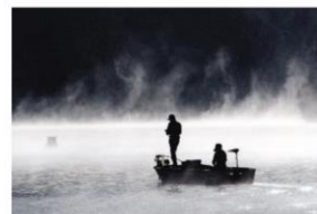
5席「朝もやの中」宇都宮 雅江 (フタバラス)