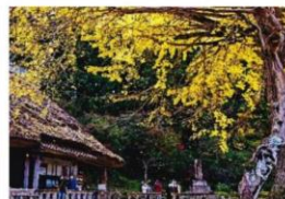
10席「イチョウ吹雪」 飯國 清(広島)