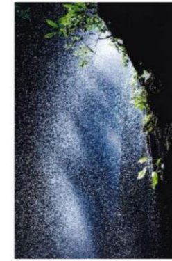
6席 「滝しぶきの中」 木山 聖 (デジタル広島)