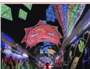
9席「怪人」 西尾 弘 (広島タウン)