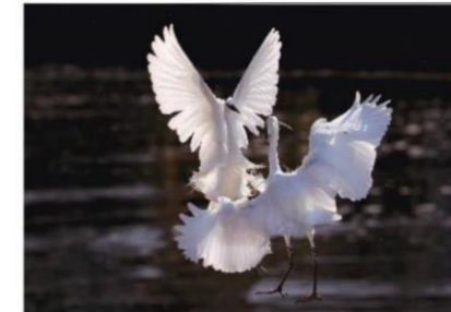
2席「手旗信号」 上本 静樹(フオプラス)